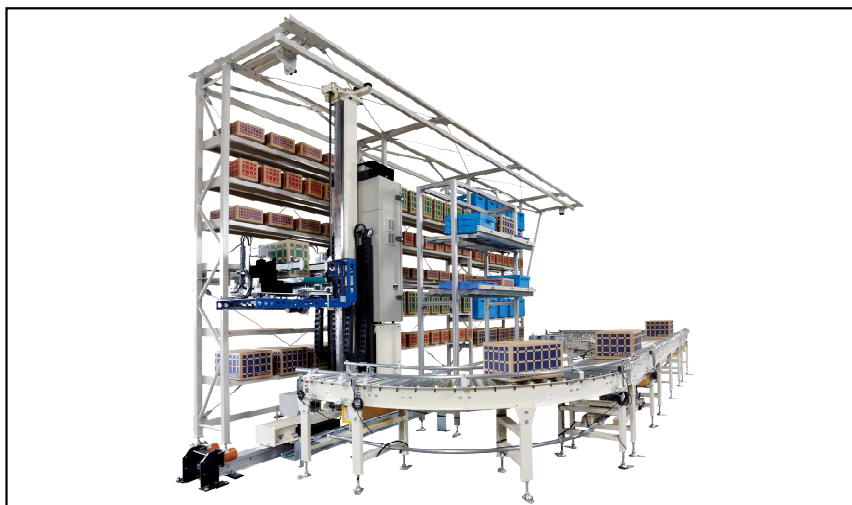
【出展機：マルチソーティングRIO】

おかげさまで、数多くの方々に「SEIBUブース」へご来場頂き、誠に有難うございました。