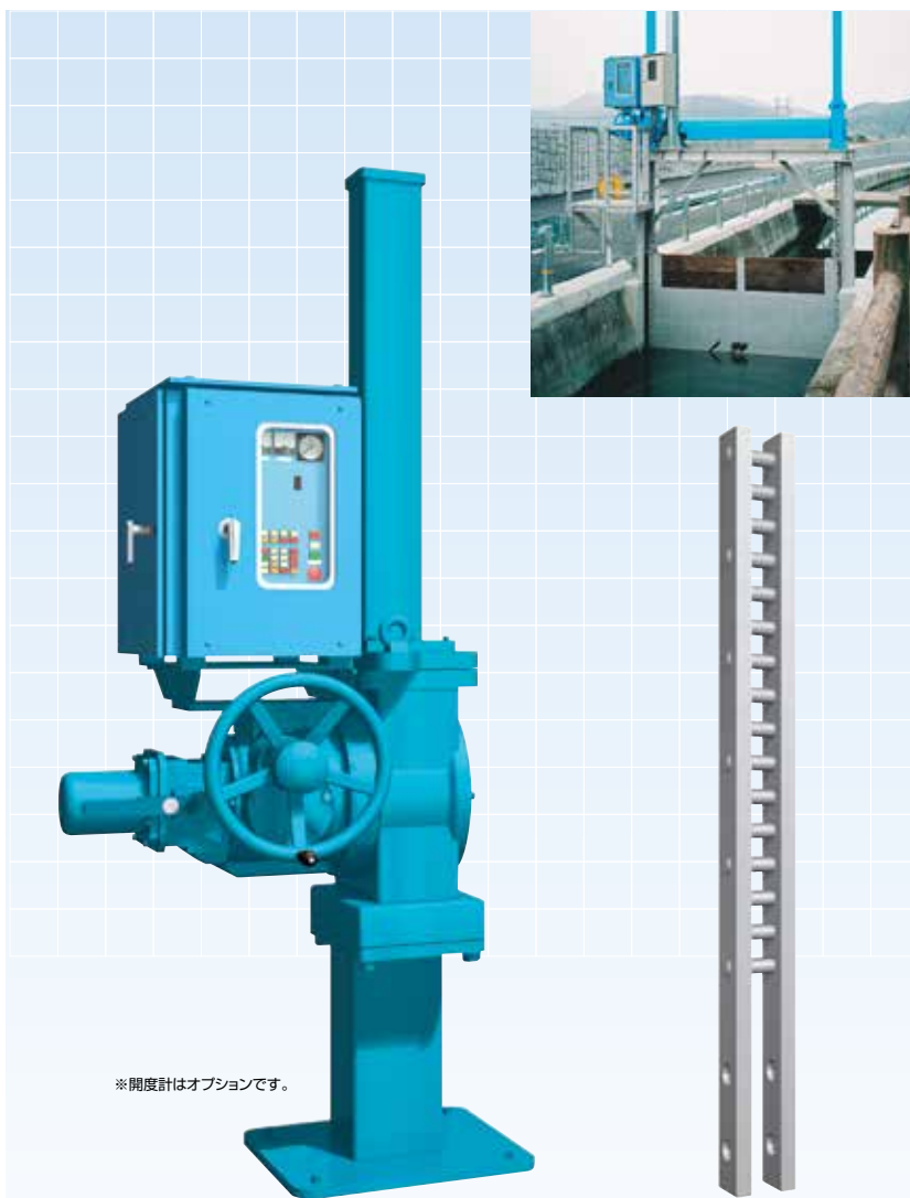
※開度計はオプションです。