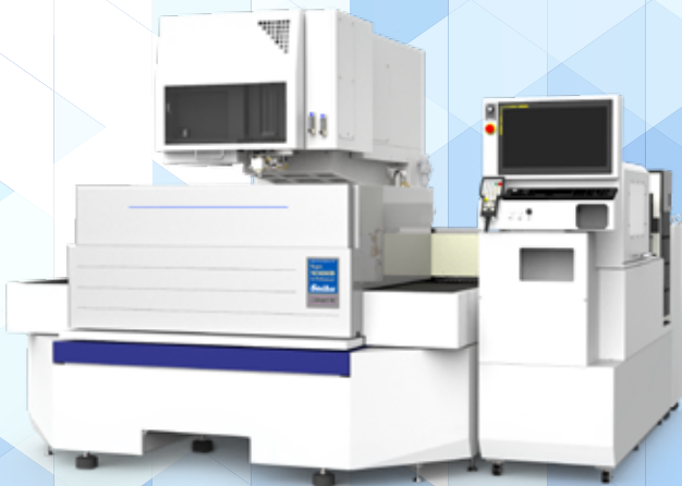
超精密大型ワイヤ放電加工機 SuperMM80B