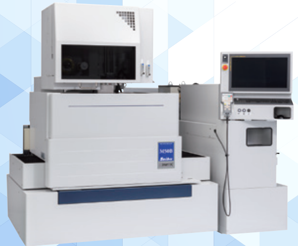
高精度ワイヤ放電加工機 M50B