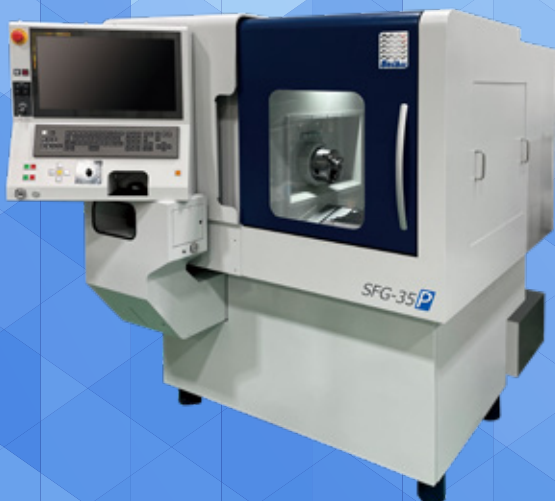
高精度自由形状内面研削盤 SFG-35P