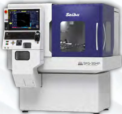
切削+研削の一貫加工を可能にしたハイブリット内面研削盤